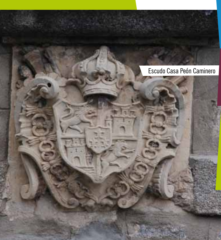
Escudo Casa Peón Caminero