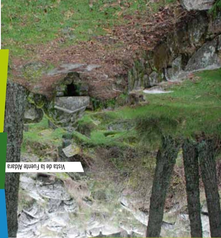
Vista de la Fuente Aldara